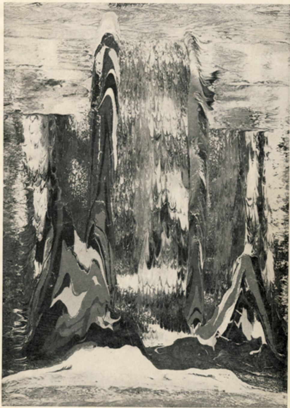
Acque e luci, 30x40 - Coll. Sig.ri André Lapointe, Laval, P.Q.