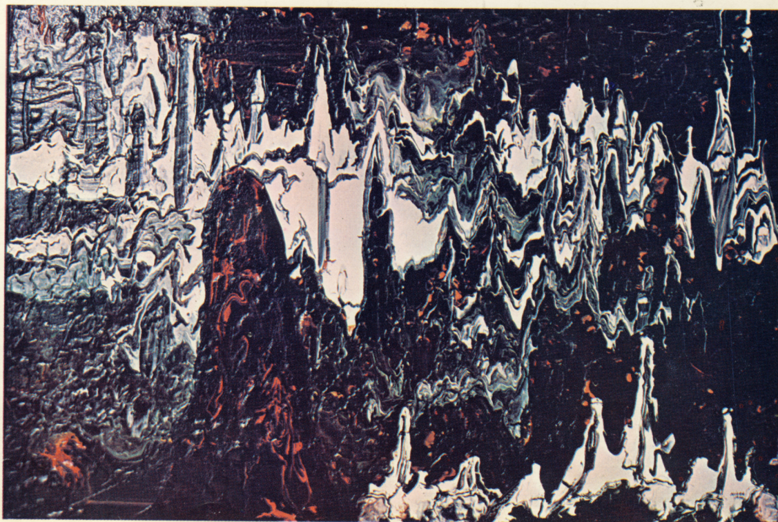
"NEIGE SUR LES LAURENTIDES" 23"x34" dyptique POR